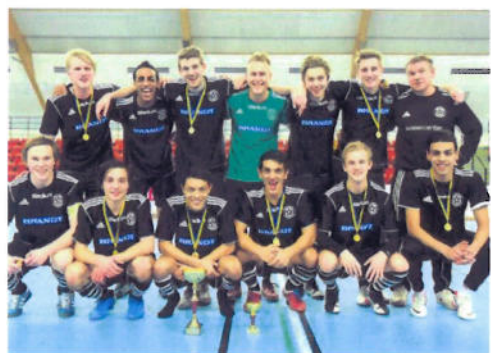
Vänersborgs FK, vinnare av Kvantum Cup 2013 och således kommunmästare.